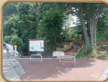
恋ヶ窪村分水入口