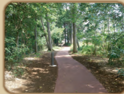
ゆうほどう遊歩道