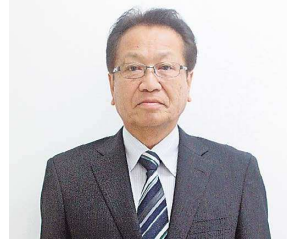
国分寺市長 井澤 邦夫

本市においては市民や医療関係者の皆様のご協力により、この2か月余り新型コロナウイルス感染症の感染拡大が抑制されてきております。しかし東京都では現時点においても警戒を要するレベルであり、今後の第二波到来も見据えて依然として備えを緩める状況にありません。