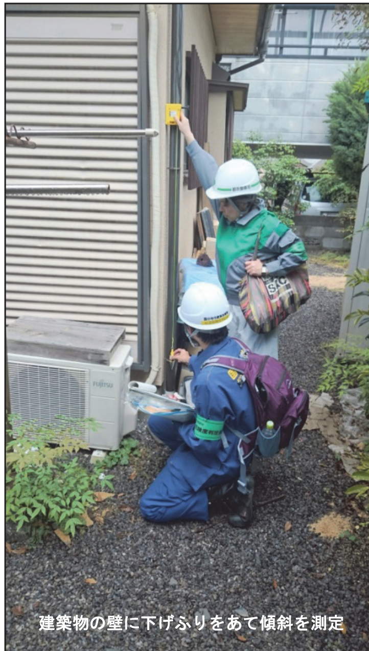
建築物の壁に下げふりをあて傾斜を測定

判定の結果、「危険」が約27%、「要注意」が約33%、「調査済」が約40%となっている。