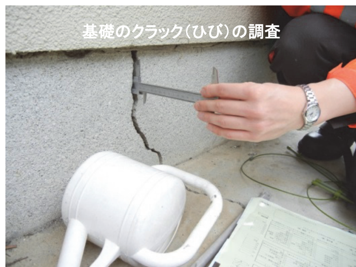
基礎のクラック(ひび)の調査