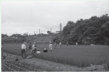
西恋ヶ窪の水田風景(昭和33年)

そのわずか4年後の明暦3年(1657)、国分寺村・恋ヶ窪村・貫井村(現小金井市)が玉川上水から水田用水を引水することを願ひ出て許可され、合同の分水口が設けられました。この分水は「国分寺村分水」や「国分寺村外ニヶ村組合分水」と呼ばれ、開削当初は、上水新町3丁目付近の玉川上水から直接取水し、現在の窪東公園の西側を南下して恋ヶ窪交差点で貫井村分水と分かれ、東恋ヶ窪五丁目交差点東側で国分寺村分水と恋ヶ窪村分水に分かれるルートでした。このような玉川上水分水は武蔵野台地の至る所を流れていました。その後、明治3年(1870)に分水口の統廃合が行われ、南野中新田分水(現砂川用水)から引水されています。