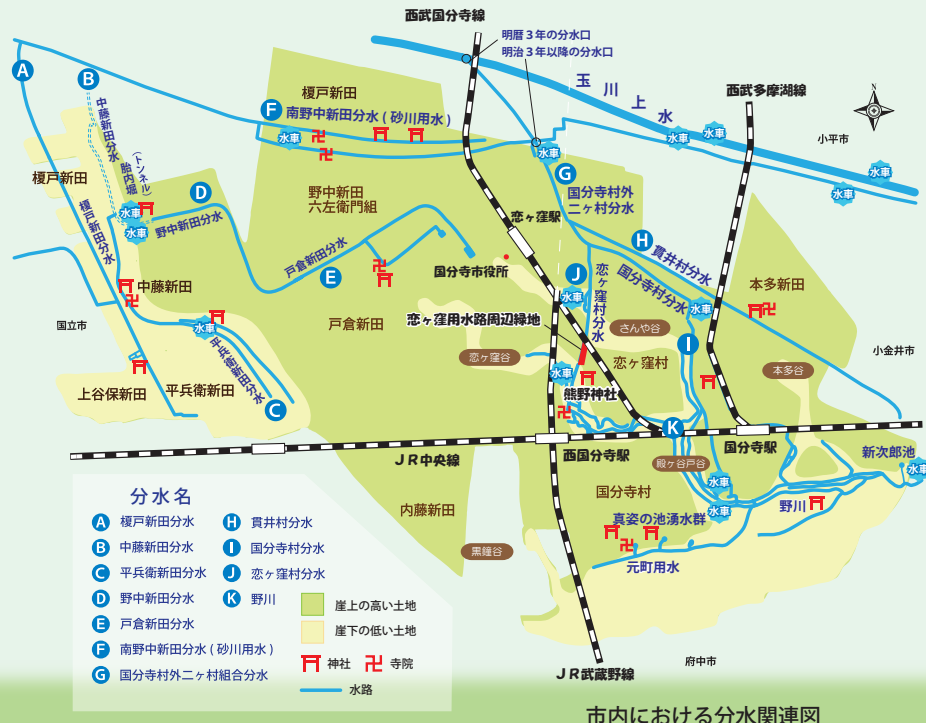
市内における分水関連図

市内には分水を利用した水車の痕跡、水の祭祀に係る寺社などの文化財が多く残されており、今後も市はそれらの保護と活用を進めていきます。