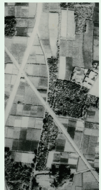
恋ヶ窪村分水周辺空撮写真(昭和22年)

調査の結果、恋ヶ窪村分水の大規模な堀割は当時の姿を残す土木遺産として貴重であることから、明暦3年(1657)の開削から360年にあたる2017年に市重要史跡に指定をし、翌年7月には恋ヶ窪用水路周辺緑地としてオープンしています。