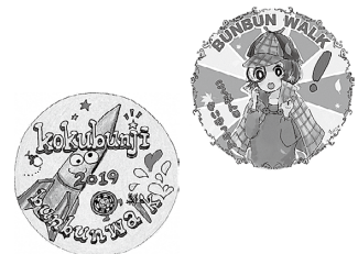
昨年の缶バッジイラスト

申 10月16日(金)までに、氏名・電話番号とイラスト(JPEGデータ)をメールでぶんさんウォーク実行委員会事務局へ※イラストの周りに文字を入れる場合あり