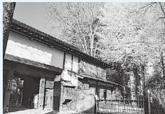
⑥おたかの道湧水園