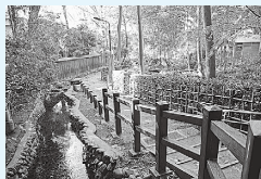
⑤お鷹の道・真姿の池湧水群