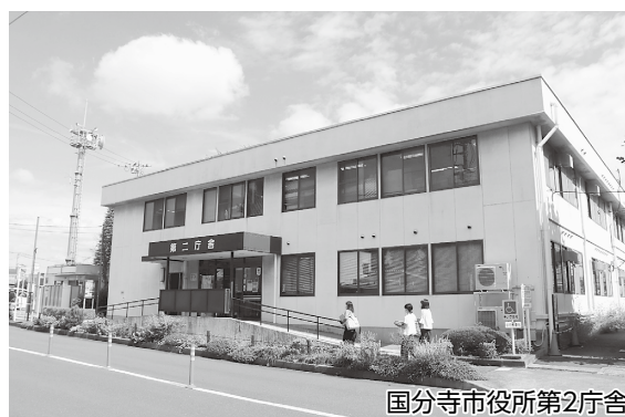
国分寺市役所第2庁舎