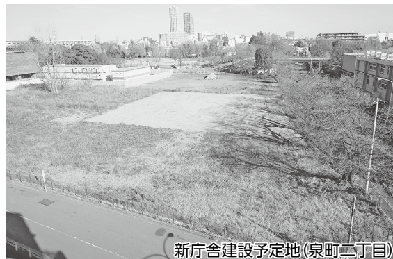
新庁舎建設予定地(泉町三丁目)