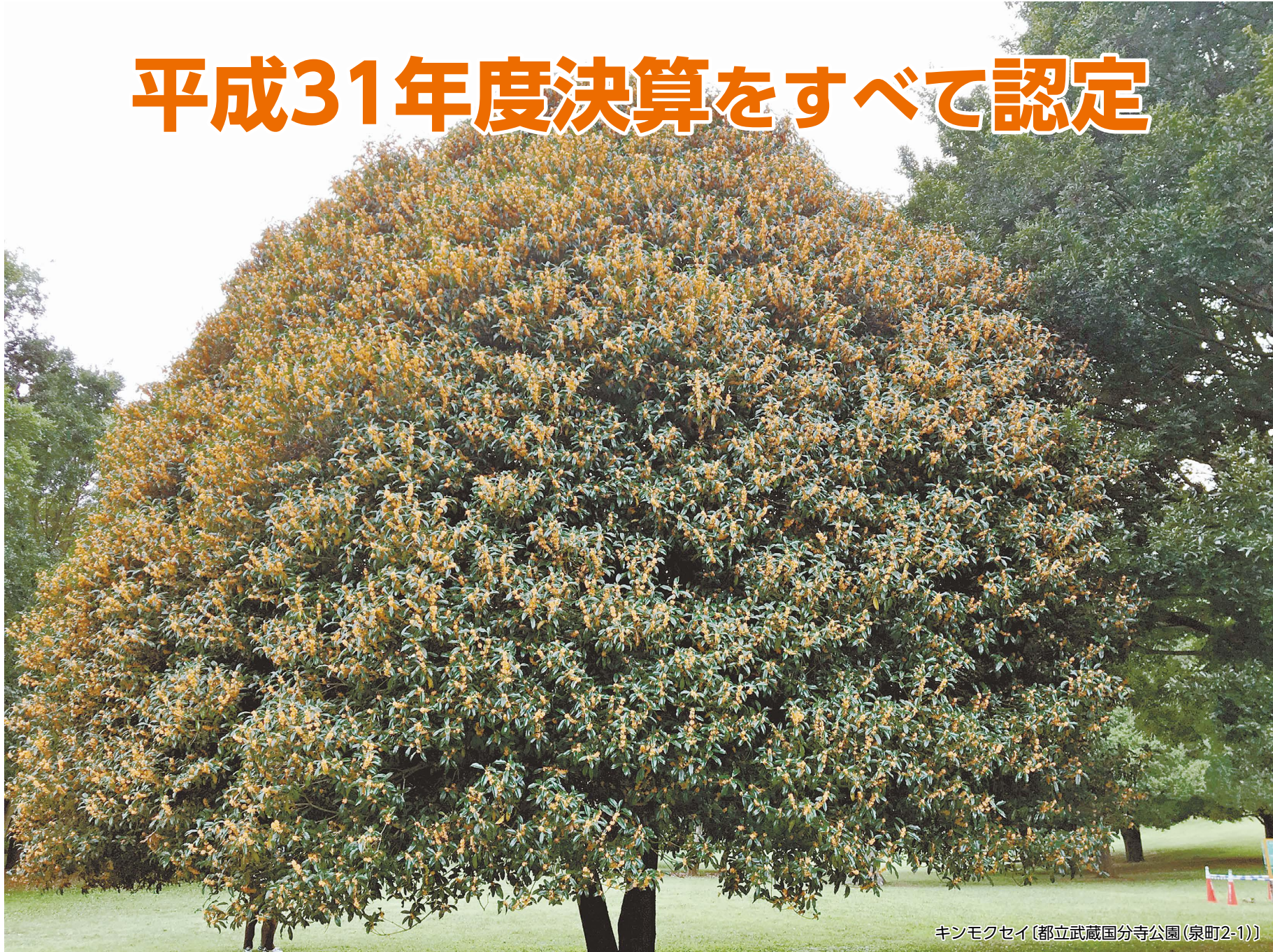
キンモクセイ [都立武蔵国分寺公園(泉町2-1)]