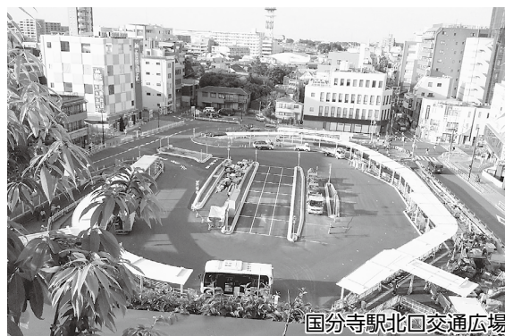
国分寺駅北口交通広場