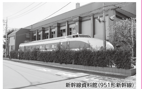
新幹線資料館(951形新幹線)