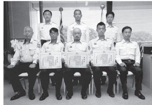
市消防団の第一・四・六分団が、東京消防庁防災部長賞を受賞しました。これは3月22日に泉町で発生した建物火災での消火活動で、延焼被害を最小限に抑えた功労を認められたものです。