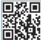
▲こちらからアクセス