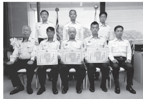
市消防団の第一・四・六分団が、東京消防庁防災部長賞を受賞しました。これは3月22日に泉町で発生した建物火災での消火活動で、延焼被害を最小限に抑えた功労を認められたものです。