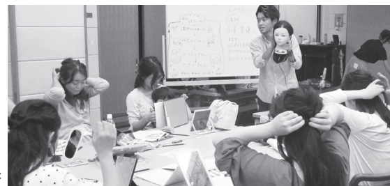
平成30(2018)年度光公民館住民自主講座 「プロから学ぶ幼児のカット&ママのヘアアレンジ」

保育室50周年という節目の年にあたり、12月4日には記念事業の開催、記念誌の発行を予定しています。保育室活動のこれまでとこれからをつなげられるような事業を、保育室に関わる市民の皆さんとともに準備していきます。