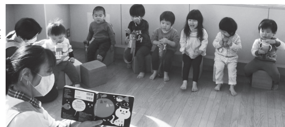
保育室での読み聞かせの様子