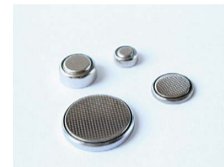
ボタン電池(取り出せないおもちゃ・腕時計なども含む)