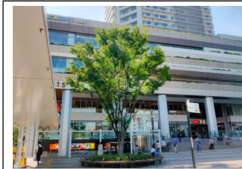
駅前広場のシンボルツリー

国分寺駅北口を出て西側。国分寺市のある武蔵野台地の森と狭山丘陵地の森のゾーンがあり，各々に“手入れされた雑木林”と“自然林に戻りつつある雑木林”のエリアがあります。