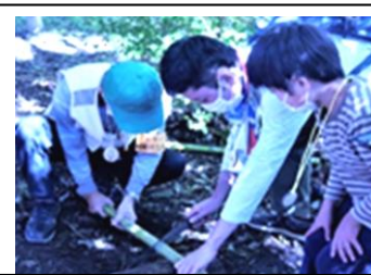
親子で竹水鉄砲作り