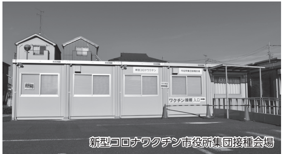
新型コロナワクチン市役所集団接種会場