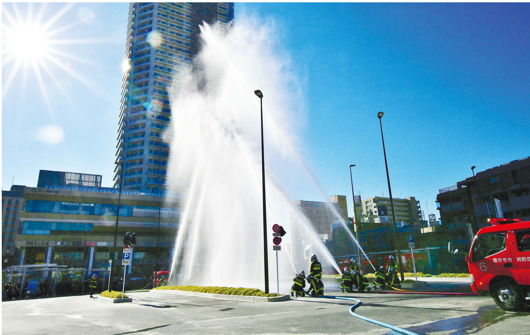
第43回こくぶんじ写真コンクール 国分寺市議会議長賞 受賞作品 「2022年出初式」

●令和4年第1回定例会を2月18日（金）から3月22日（火）の会期33日間で開催しました。