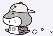
国分寺市嘴ミング30(サンマル) 食育推進キャラクター カメ(噛め)ちゃん

市内在住で40歳~74歳の方 ※入れ歯を使用している方も可 歯科医師による口腔内診査・舌圧測定(飲み込む力の検査)・パタカ測定(口唇や舌の動きを検査)・歯科相談 14人初めの方優先 ※先着順。