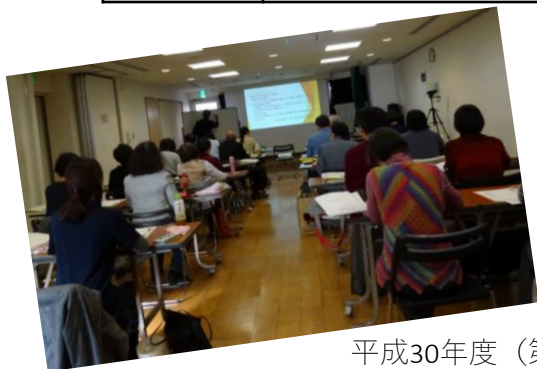
平成30年度（第一期）養成講座の様子