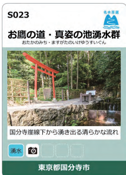
表側 名水の写真、自治体名、部門別ピクトや部門順位