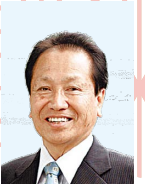
国分寺市長 井澤 邦夫