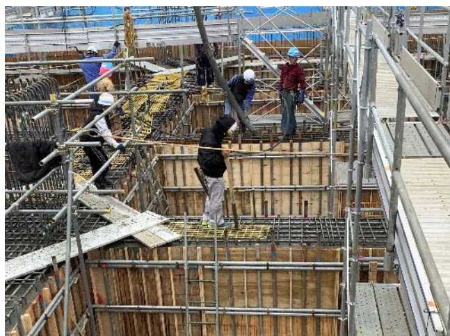
基礎梁コンクリート打設 (2/8)