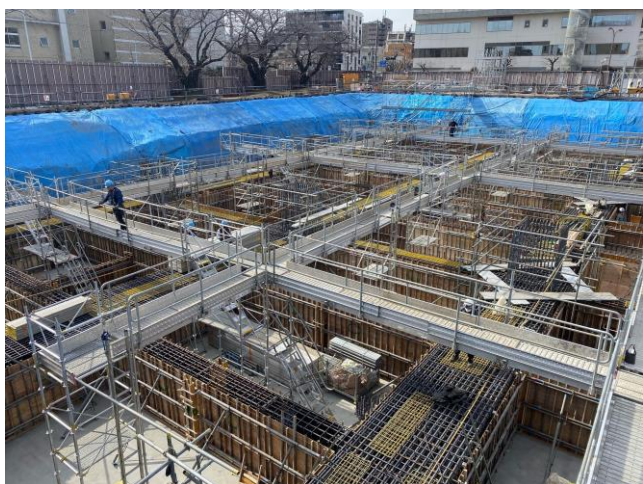
基礎梁配筋・型枠設置 (2/7)