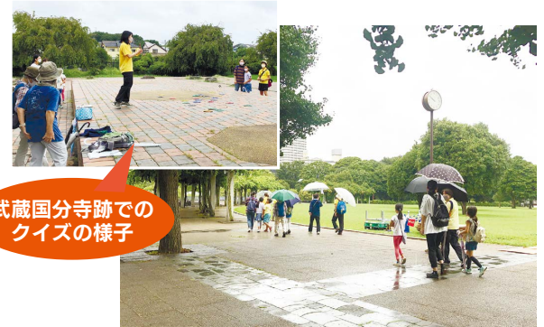
武蔵国分寺跡でのクイズの様子

市内に設定した5か所の史跡地などのポイントで、オリンピック・パラリンピックに因んだクイズに答えながらゴールを目指すウォーキング&クイズラリーを行いました。参加者をチームに分け、チーム対抗で勝敗を競いました。小雨も降る天候でしたが、イベントを通して参加者の皆さんは、国分寺市の魅力を再発見しました。