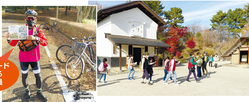
ビンゴカードを掲げる推進委員

国営昭和記念公園(立川市)を会場として、地図をもとに時間内に公園内のチェックポイントを回り、指定の写真を撮影して、得点を集めるスポーツイベントを開催しました。今回は「ポイントチェック×ビンゴ」のオリジナルルールで開催。晴天の下、2時間たっぷり園内を散策し、知らなかった場所を自分の足で巡るワクワク感を、子どもも大人も楽しみました。