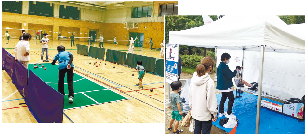
カヌー体験(パラスポーツ体験)の様子

毎年スポーツの日に、市民の皆様に気軽にさまざまなスポーツを楽しんでいただくスポレクまつりを開催しています。今年度はブラインドフットボールやカヌー、VRを活用した車椅子レーサーといった競技を体験できるパラスポーツコーナーも設け、たくさんの方が普段体験できない各競技へのチャレンジを楽しみました。