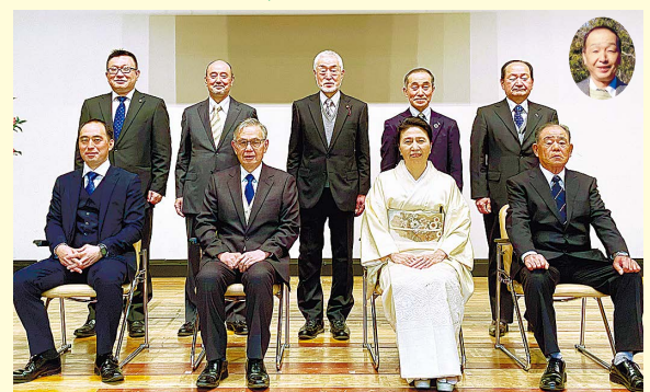
各表彰受賞の皆さんをお祝いしました