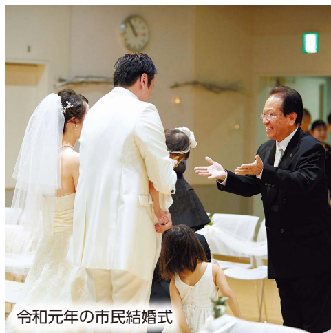
令和元年の市民結婚式