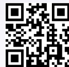
環境省熱中症予防情報サイト