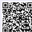
とうきょう健康ステーションサイト