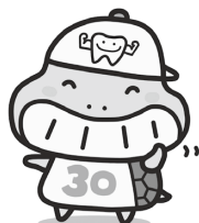
「カメ(噛め)ちゃん」国分寺市 噛ミンク30(サンマル)・食育推進キャラクター