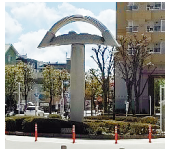
関根伸夫 《天平人の夢》 西国分寺駅南口 ロータリー

申5月30日(火)までに件名に「アート」、本文に氏名、住所(町名のみ)、電話番号、希望日を明記しメール(裏面下記参照)、電話または直接もとまち公民館へ。多数の場合は抽選。定員に満たない場合は、翌日以降先着順