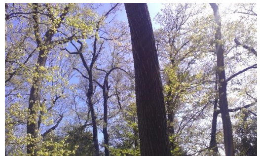
ハケの雑木林から青空を望む

ハケの学習の他にも学校の教育活動や学校の施設そのものが、子どもたちや教職員と保護者や地域の方々、また保護者同士、地域の方同士がつながり合える場となれたらすてきなことだと思っています。子どもたちや教職員は、保護者や地域の方々为学校に来てくれて嬉しかった、とても助かったと感じ、保護者や地域の方々は学校に行くことが楽しい、ためになった、仲間が増えたと感じることができる、まさにウィンウィンの関係を築いていきたいと考えます。そのために、学校は地域を知り、保護者や地域の方々には八小のことを知ってもらい、保護者や地域の方々为学校に集い、つながりをもてる機会をつくってまいります。地域と共に子どもたちを育てる「コミュニティ・スクール」のその先にある、学校を核とした人々の結びつき、絆を深める「スクール・コミュニティ」を目指し、微力ながら努力をしてまいります。保護者の皆様、地域の皆様、第八小学校はこれからも敷居の低い学校を目指してまいります。どうぞ気楽に足を運んでいただきますようお願いいたします。