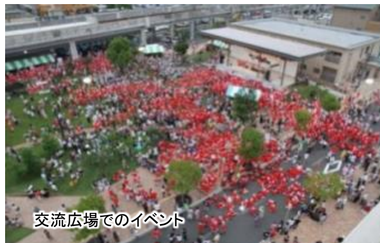
交流広場でのイベント