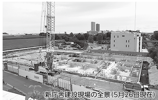
新庁舎建設現場の全景(5月26日現在)