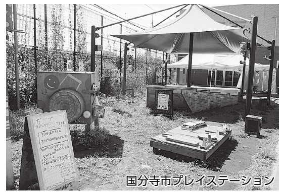
国分寺市プレイステーション