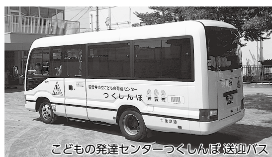
こどもの発達センターつくしんぼ送迎バス