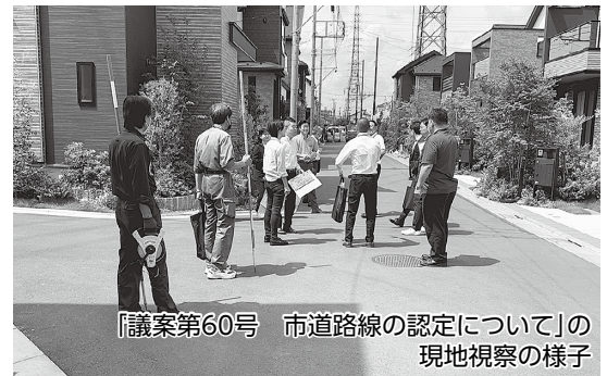
【議案第60号 市道路線の認定について】の現地視察の様子