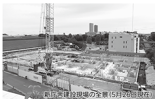
新庁舎建設現場の全景(5月26日現在)