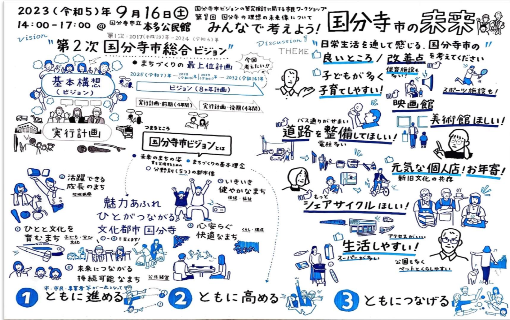
【第1回市民ワークショップ】グラフィックレコーディング（国分寺市総合ビジョンの紹介・テーマ①）