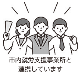
市内就労支援事業所と連携しています

☎(042)300-1500またはFAX(042)324-1718で※面談は申し込み制 場泉町2-3-8(市障害者センター内)