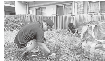
マンションの清掃やご家庭の除草作業も行います

加盟事業所この里、どーむ、希望園、食彩工房プラスワン、ともしび工房、さつき共同作業所、ビーパス、オハナ農園、チェンジアップ、喫茶ほんだ・こだま、まほろば、市社会福祉協議会(協力団体)