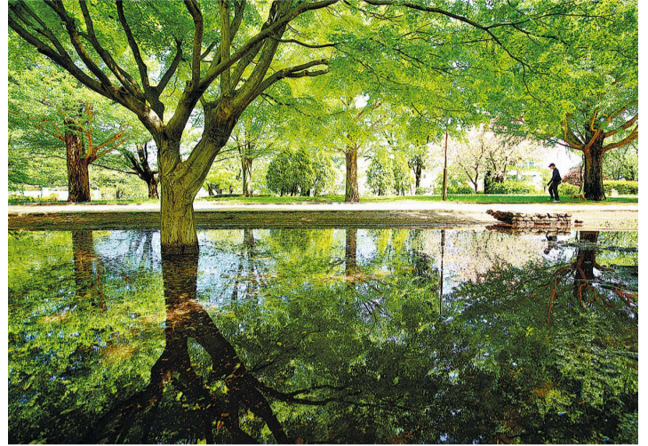
前回入賞作品 こくぶんじ観光まちづくり協会長賞「長雨上がり」▲

📌令和4年1月1日以降に応募者本人が市内で撮影した未発表の作品で、JPEG形式(約2MB以上10MB以下)のもの