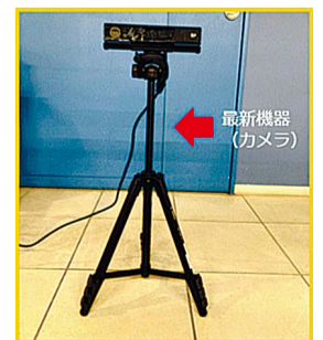
カメラに向かって6m歩き、歩行年齢を算出します