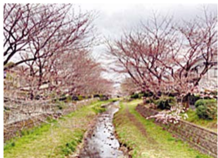
自然な状態に整備された小金井市エリアの野川