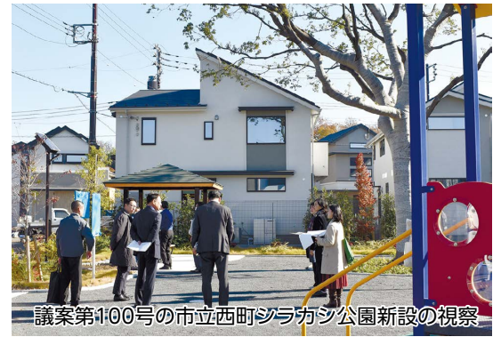
議案第100号の市立西町シラカシ公園新設の視察