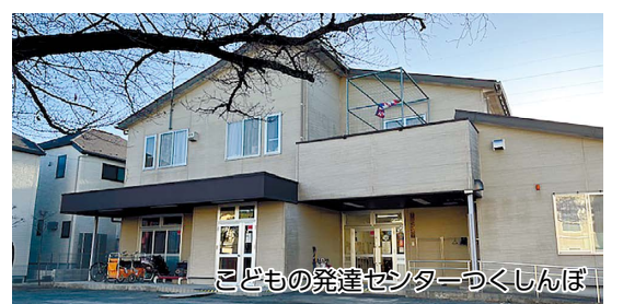
こどもの発達センターつくしんぼ