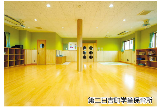
第二日吉町学童保育所

・国分寺市立こどもの発達センターつくしんぼ相談支援事業所運営業務委託について など