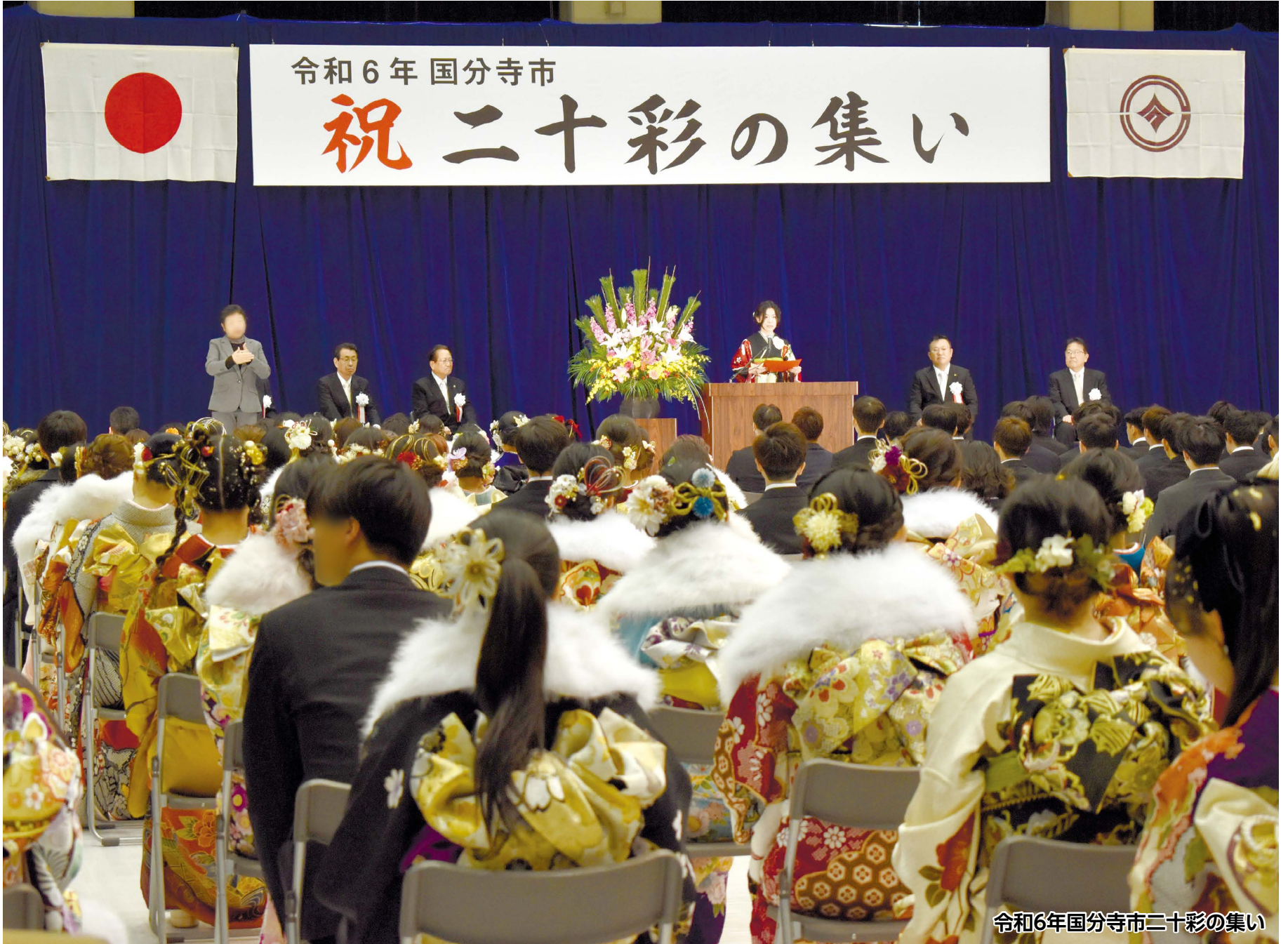
令和6年国分寺市二十彩の集い