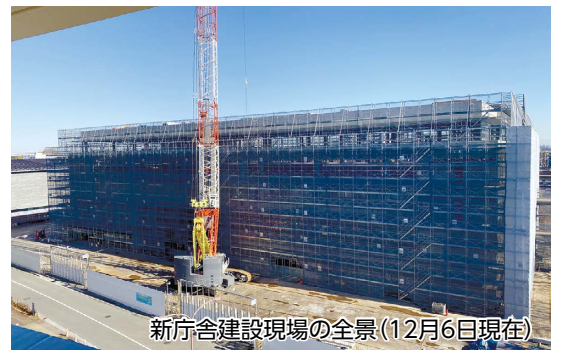
新庁舎建設現場の全景(12月6日現在)

重ねた結果、一つのスペースとしては設置せず、受付カウンターの家具や待合ソファを子どもや親子が安心して使えるものにして対応する方向で検討している。今回の意見や要望を踏まえ、担当課と調整したい。