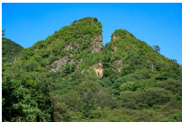
世界文化遺産 佐渡島の金山