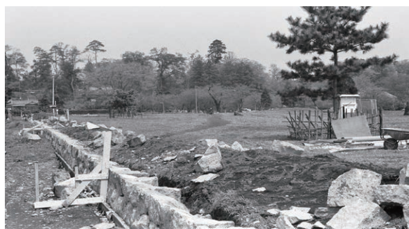
昭和46年度の環境整備工事の様子

その後も遺跡の詳細な姿が判明するとともに史跡範囲を広げ、平成22年(2010)には東山道武蔵路跡が附指定を受け、令和3年度には僧寺伽藍中樞部の区画溝跡と周辺地点を含んだ箇所が史跡に加わり、11回の追加指定を経て、令和4年6月現在の総面積は約1,650,000㎡となりました。同時に史跡地の整備も進められ、現在では主に僧寺伽藍や尼寺が史跡公園として市内外の方々にも親しまれています。この様に、武蔵国分寺跡が歩んだ足跡は決して平たんなものではなく、当時の社会状況や諸問題に直面しながら、史跡や文化財を後世に残す方法を模索してその姿を今日まで残しています。(石井 秀和)