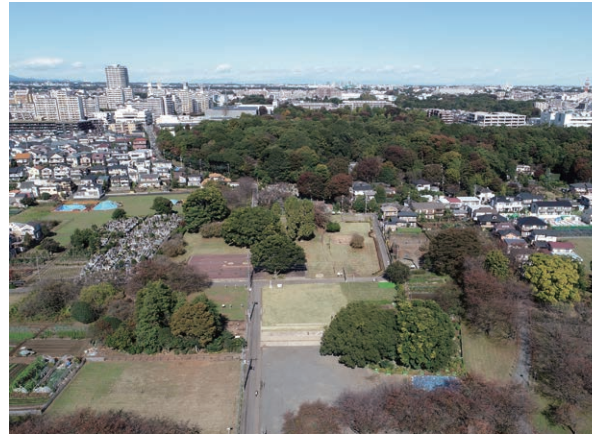
武蔵国分寺跡僧寺中樞部

令和4年度は史跡指定100周年を記念する年として、年間を通して記念事業を展開していきます。去る4月29日には、史跡指定100周年記念オープニングイベントを開催しました。オープニングイベントの午前の部では、文化庁主任文化財調査官 おうち としひで の近江俊秀氏による「史跡武蔵国分