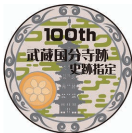
100周年教育推進マーク