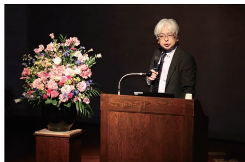
近江主任文化財調査官による記念講演