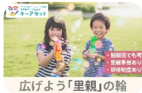
広げよう「里親」の輪