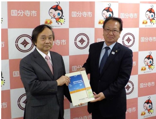
平成 31 年 4 月 16 日、まちづくり協議会の市川会長（左）から市長へ計画（案）の報告を行いました。