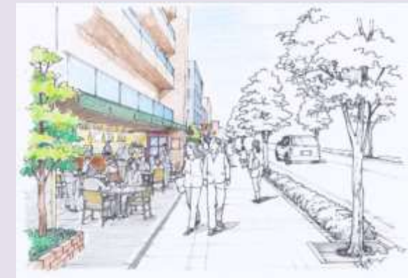
まちなみのイメージ

中高層建築物の立地を誘導し、特に、駅に近い北側のエリアでは、低層階に店舗等があり学生や住民が集い楽しむことのできるまちを目指します。