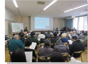
日時：11月26日（土）10:00～11:30 会場：もとまち公民館 参加者：39名