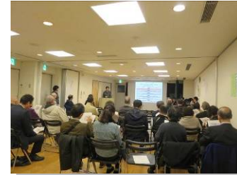
日時：11月25日（金）19:00～20:30 会場：本町・南町地域センター 参加者：24名

■説明会では、まちづくり推進地区の指定範囲、今後の国分寺街道のあり方など、ご質問やご意見をいただきました。いただいたご意見は、今後のまちづくりに活かしていきます。