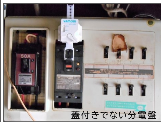
蓋付きでない分電盤