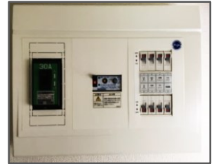
※1 写真イメージ (分電盤全体が写る写真)