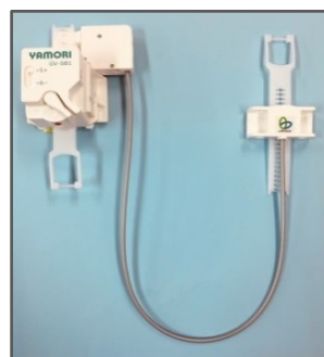
(株)リンテック 21 ヤモリ(本体)+ヤモリ・ デ・リモート (ふた付分電盤用付属品)