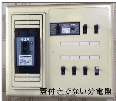
蓋付きでない分電盤