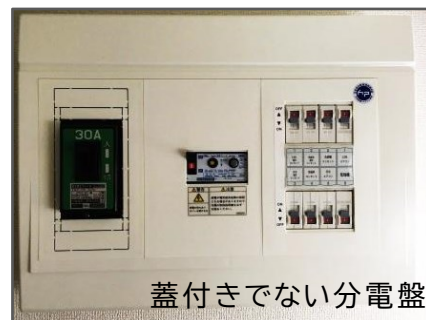
蓋付きでない分電盤