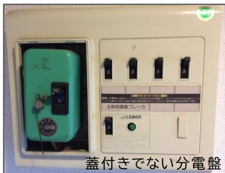
蓋付きでない分電盤