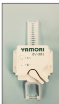
(株)リンテック 21 ヤモリ(本体)

支給する下記の感震ブレーカーは、地震の揺れ(震度5強以上)を感知した場合に、バネの力で漏電ブレーカー等を操作し、電力供給の遮断を補助する器具になります。