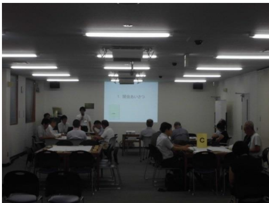
当日の様子①（全体説明）