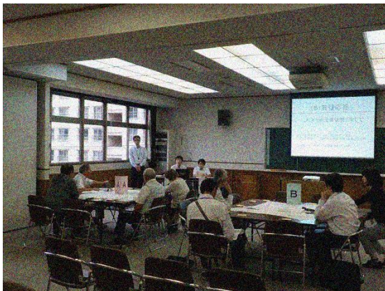
当日の様子①（全体説明）