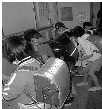
登校したらすぐに手洗いうする子供たち