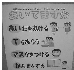
各学級に掲示された三密を避けるポスター