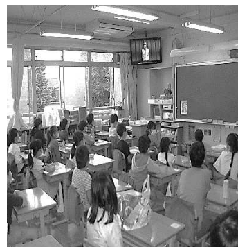
TV放送を静かに見入る姿が見られました。