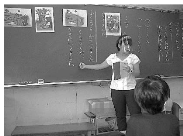
フェイスシールドを付けて授業