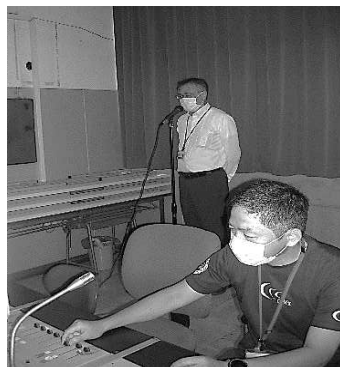
今年度初の全校朝会はTV放送で行いました。