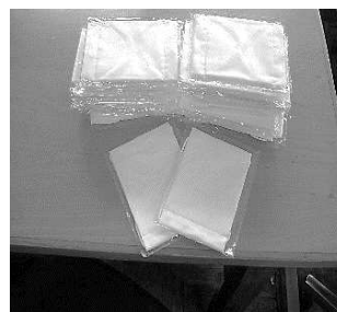
文部科学省から届いたマスクを各家庭に配布しました。