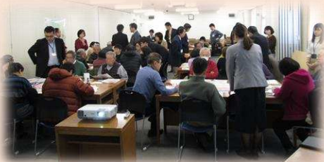
第3回地域懇談会の様子

令和2年2月1日に3回目となる地域懇談会を開催し、ワークショップ形式で話し合いやグループ意見の発表を行いました。