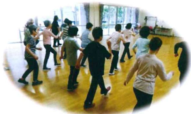
いきいきセンター