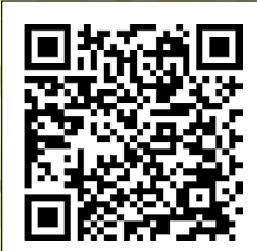
第42回こくぶんじ写真コンクール特設サイト