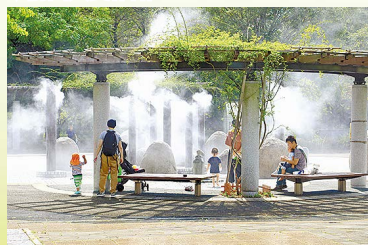
市観光協会長賞「ミスト」