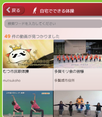
自宅で出来る体操動画 画面イメージ

適切な運動や活動を行うための フローチャートや運動・ 活動メニューを閲覧できます。