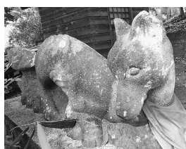
稲荷神社の白狐像 (光町)

申 12月24日(木)までに電話または直接光公民館へ。多数の場合は抽選。定員に満たない場合は、12月25日(金)以降先着順