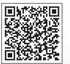
▲こちらからアクセス

注 予約の際には交付通知書が必要。電話予約は回線の混雑が予想されるため、インターネット予約をご利用ください。個人番号カード交付以外の手続きはできません