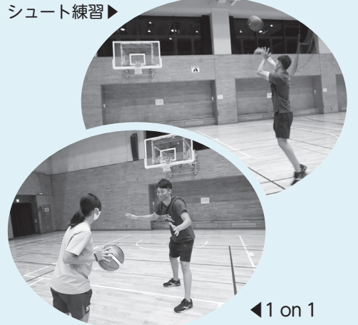
シュート練習 ▶ ◀ 1 on 1 (*) 攻守に分かれて1対1で競うこと →スポーツ振興課(内279)

個人開放日にはスポーツセンターでバスケットボールの個人練習ができます。1on1(*)やシュート練習など、個人の技術を磨いてみませんか。