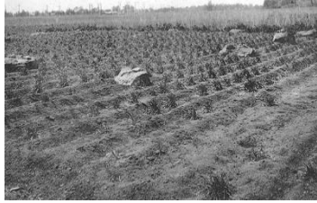
大正 11 年