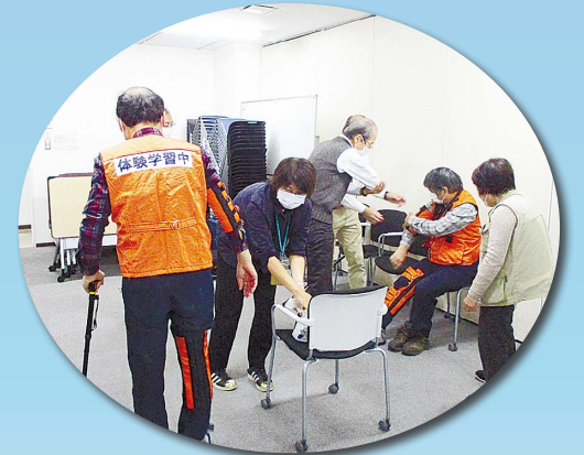
高齢者体験の様子

申各回の開催1か月前までに電話または直接防災安全課へ※先着順 注下表(★)の講座を除く