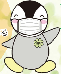
東京都民生委員・児童委員キャラクター ミンジー▲