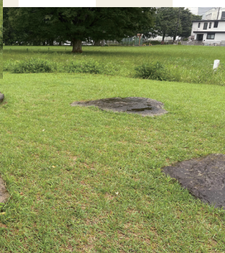
上総国分寺跡（七重塔跡）