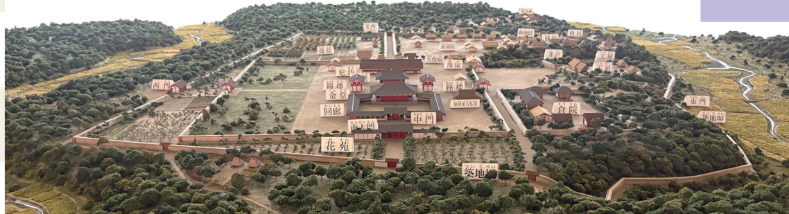
上総国分尼寺跡（展示館）