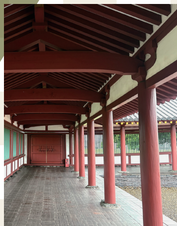
上総国分尼寺跡（復元回廊）